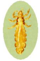
アタマジラミの成虫

アタマジラミというと不潔の代名詞のように思われていますが、衛生状態に関係なく感染します。特に保育園、幼稚園、低学年児童に季節を問わず発生します。頭や体をくっ付けて遊んだり、集団で昼寝をしたりすることが蔓延の原因になっているようです。最近では海外渡航者が日本国内に持ち込む場合や知識不足から広く感染するケースが増えているようです。