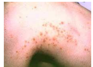
チャドクガの幼虫による皮膚炎

皮膚炎を引き起こす原因となる主な虫としては蚊、ノミ、ブユ、ハチ、トコジラミ、アブ、毛虫などの昆虫類、そしてダニ、クモ、ムカデなどの昆虫以外の節足動物があげられます。これらのうち、「吸血する虫」としては蚊、ブユ、アブ、ノミ、トコジラミ、「さす虫」としてはハチ、「かむ虫」としてはクモ、ムカデが代表的で、「触れることで皮膚炎をおこす虫」としては有毒の毛虫(チャドクガの幼虫など)があげられます。他に「虫」ではありませんが、クラゲやヒトデ、魚類などの海生動物にも刺すものがあり、皮膚炎を起こすことが知られています。