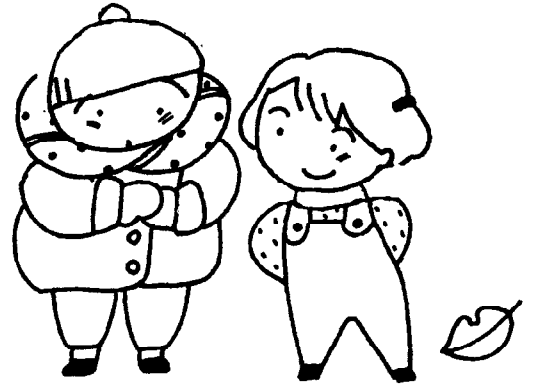
厚着してるのどの子かな？